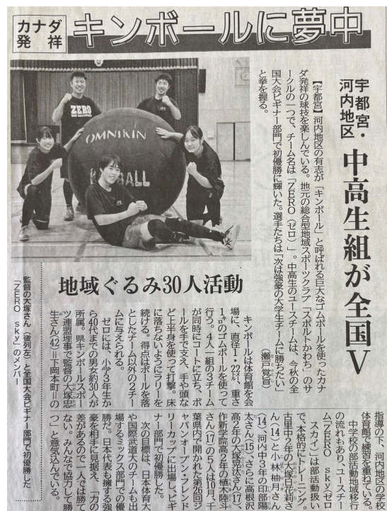
下野新聞令和7年12月23日21面 掲載。