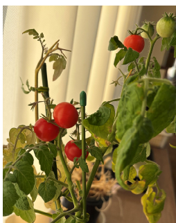
職員室のミニトマト。 豊作です！