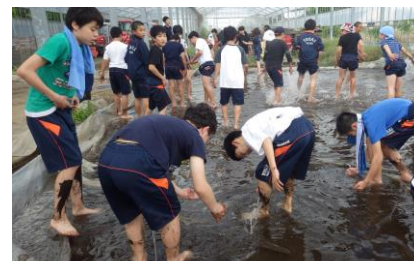
ビニールハウス内での足洗い