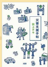
『災害支援手帖』 荻上チキ著 木楽舎