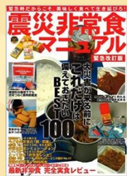
『震災非常食マニュアル』 オークラ出版