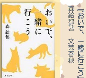
『おいで、一緒に行こう』 森絵都著 文芸春秋