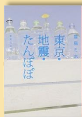
『東京・地震・たんぽぽ』 豊島ミホ著 集英社