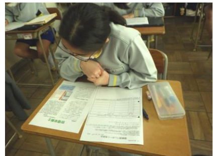
「職業調べ」発表会の様子