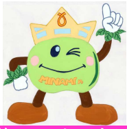
学校マスコット：みなみん