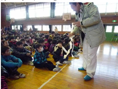
<鉋かけでできた薄い皮>