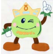
学校マスコット：みなみん