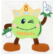
学校マスコット：みなみん