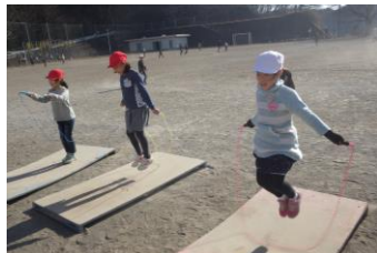
(縄跳び、頑張っています！)