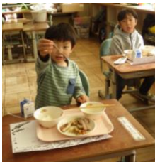
(骨がこんなにきれいに)