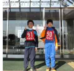
(市スケート大会出場)