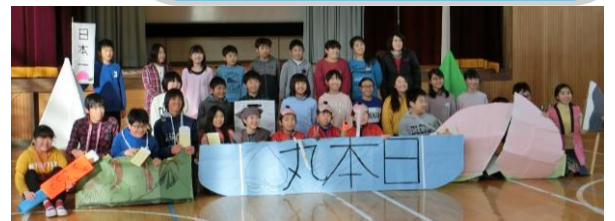
(6年 学年朝会・・・桃太郎の英語劇に挑戦しました。道具類は全て手作り。1～5年生に最上級生の「力」をアピールしました。)