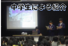
中学生による紹介

豊郷中学校には、入学予定の195名の6年生が集まりました。生徒会による「中学校生活についての紹介」を聞いた後、授業見学と部活動見学を行いました。他の小学校の児童もたくさんおり、緊張しながらも楽しそうに見学し、メモを取っていました。この取組により、中1ギャップを解消することにつながり、6年生全員がスムーズに中学校生活へと入っていけるものと思っております。