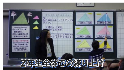
2年生全体での練習上げ