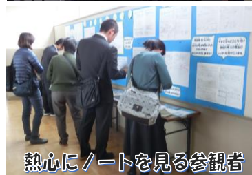
熱心にノートを見る参観者