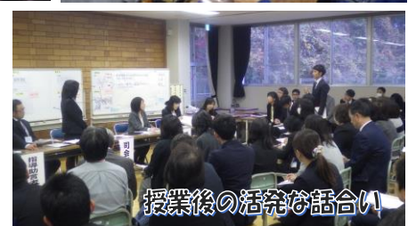
授業後の活発な話し合い