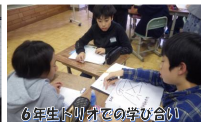
6年生トリオでの学び合い