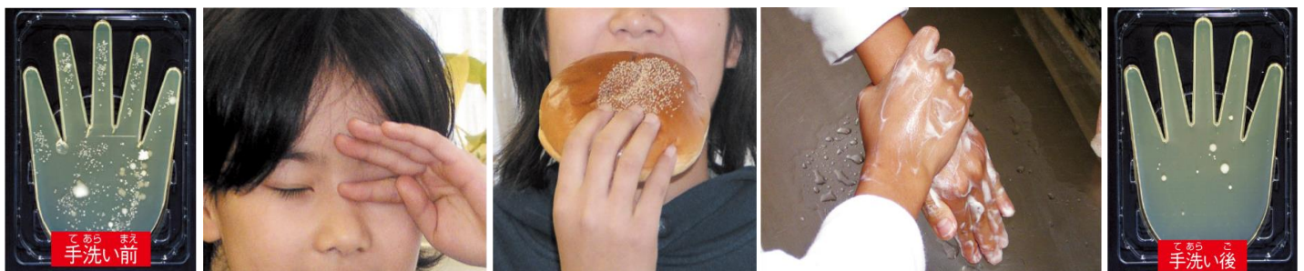
手についた 病原体