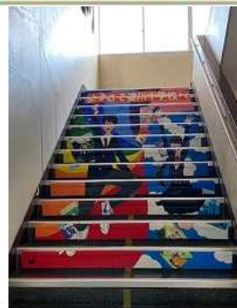
【廊下アート南校舎西階段】

引き続き、本校の教育活動への変わらぬご支援とご協力をどうぞよろしくお願いいたします。