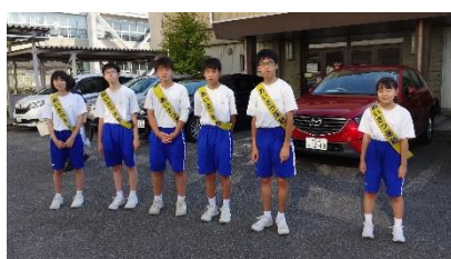
9/12 小中合同あいさつ運動