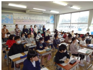
学校公開日の様子②