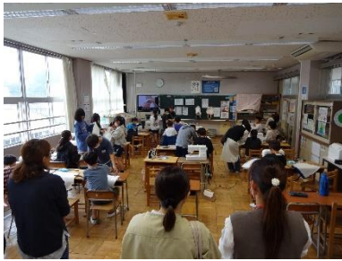
学校公開日の様子①