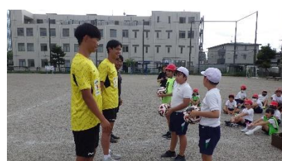
9/30 栃木SC夢プロジェクト(5年)