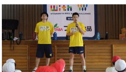
9/19 バスケットボール体験(6年)