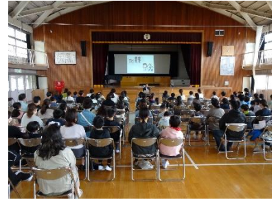
学校公開日の様子③

4月にスタートした1学期もあっという間に過ぎ、10月11日(金)に前半を締めくくる終業式を行います。