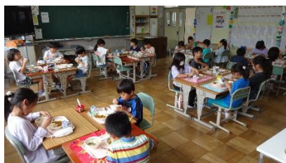
8/30 夏休み明けの学校