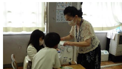
9/18・19 ミッションボランティア(5年)