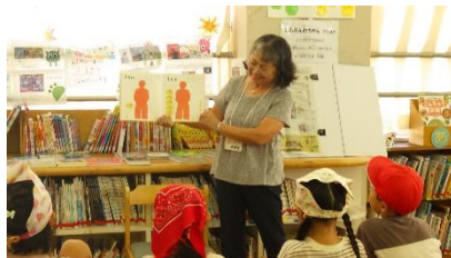
9/17 お昼の読み聞かせ