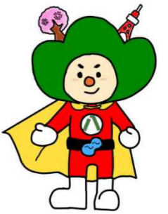
昭和小学校キャラクター