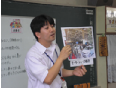
▲モーターショーの写真の提示