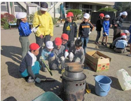
▲羽釜での炊飯体験