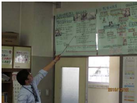
▲関係図による学習内容の確認