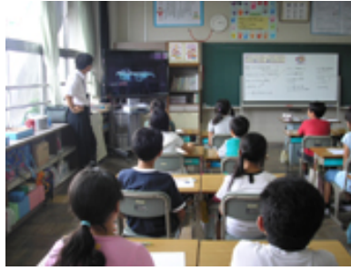
▲モーターショーのビデオを視聴