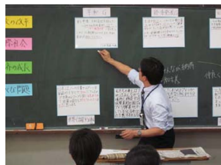
▲ 関連性を位置づける学習 のまとめ