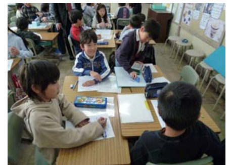
▲グループの話し合い