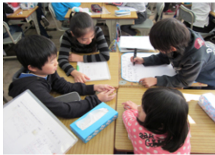
▲名主と農民に別れた話し合い