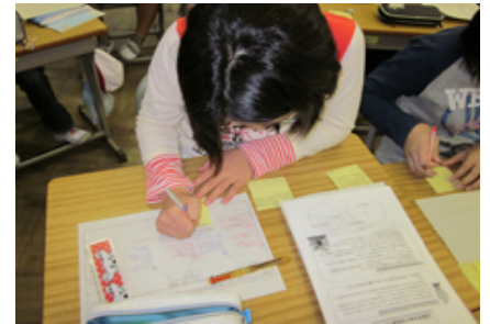
▲付箋紙を活用した振り返り