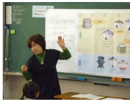
▲炊飯器の移り変わりの表を提示