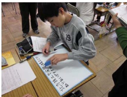
▲ホワイトボードの活用