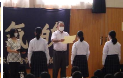
宮つ子こころの表彰を校長先生にいただきました