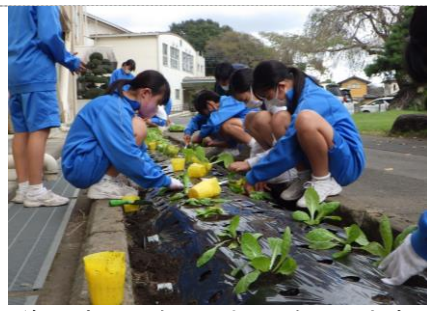
後は水やりをしてネットを張ります