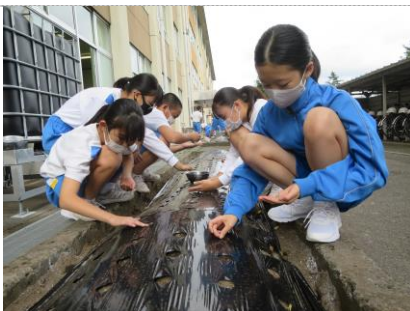
ほうれん草は6粒ずつ埋めます