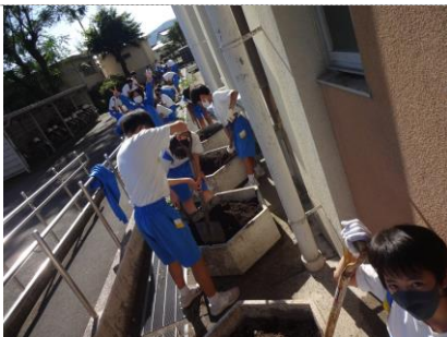
6角マスは深いので大変です