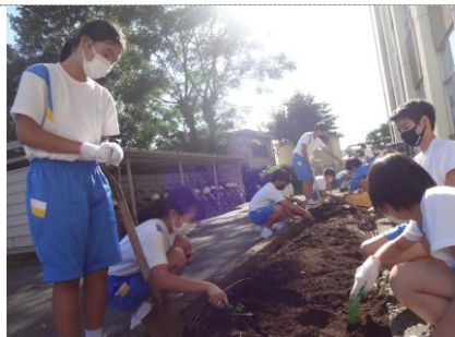
雑草を抜き、土を掘り起こします

夏はキュウリやオクラが大量にとれた畑を除草して耕し、肥料を入れてマルチを張ってから、冬野菜の植え付けをしました。今回は白菜とほうれん草です。蝶の幼虫に食べられないように、ネットも張りました。秋晴れの下、生徒たちは楽しそうに作業していました。学校ホームページにも紹介されていますのでご覧ください。