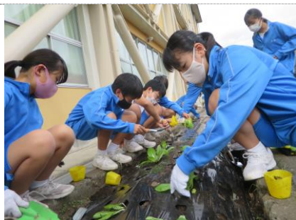
白菜の苗は柔らかいので慎重に