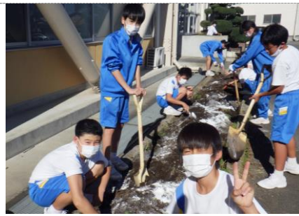
石灰やたい肥を入れて混ぜます