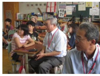
【家庭・地域の教育力向上】