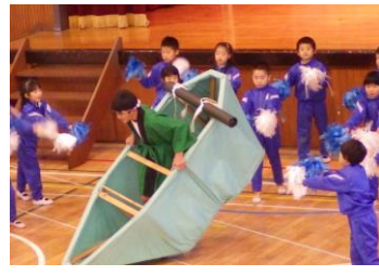
【活力ある学校づくり】