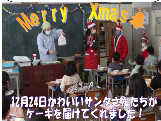
12月24日かわいいサンタさんたちがケーキを届けてくれました!

冬休み前にも、多くの2年生が一人一人「今年もお世話になりました。来年もお世話になります。」と担任に挨拶する児童が多く、とても嬉しかったです。3年生まであと少し。挨拶の他にも、たくさんの心の成長を見逃さず褒めていきたいと思ひます。