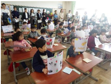
1年生「ともだちをつくろう」

また、授業参観に引き続き、学級懇談、PTA 総会、PTA 役員会まで、多くの保護者の皆様のご参加をいただき誠にありがとうございました。