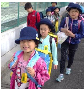
入学式の翌日から、登校班で元気に登校しています。