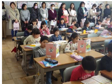
2年生「時ごとと時間」