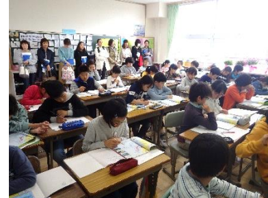
5年生「私たちの国土」