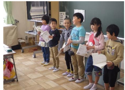
3年生「ずいせんのラップ」