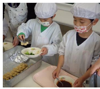
上手に配膳し、グループになって楽しく食事をしています。毎日残さず食べられました！