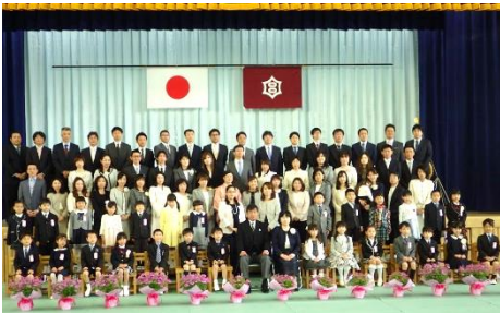
かわいい1年生の集合写真です。

また、16日(月)からは、1年生も学校給食がスタートし、担任の先生や栄養士の先生の指導・支援のもと、上手に配膳し、楽しく食事をしています。