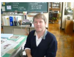
ALT ダニエル・アグヌー