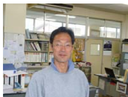
三学年 主任 (和氣)