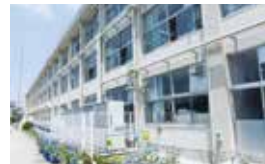
築瀬小学校 相談学級 (南校舎 1階)

教室での小集団活動や少人数でのゼミ活動、個別の活動など、一人一人の状態に合わせて活動できる教室です