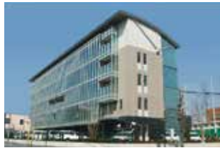
宇都宮市教育センター

このような学校の様々な取組によってもどうしても登校できずに困っている子のために、宇都宮市には、教育センターを中心とした複数の支援の場が用意されております。