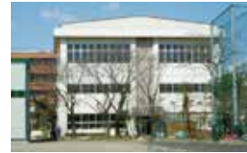
旭中学校 相談学級