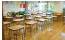
とらいあんぐる (教育センター 3階)