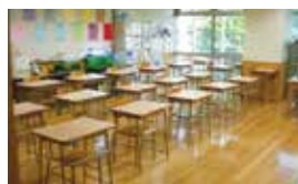
とらいあんぐる (教育センター 3階)