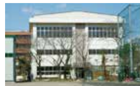
旭中学校 相談学級