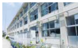
築瀬小学校 相談学級 (南校舎 1階)